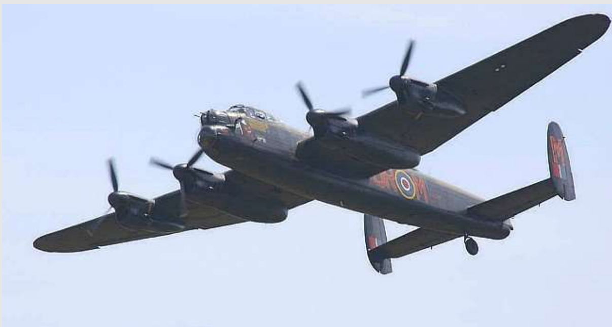
AVRO Lancaster bommenwerper

Op 17 december 1942 om 17.22 uur steeg de bommenwerper AVRO Lancaster Mk.I – ED333 met radiocode OF-B op van luchtmachtbasis Woodhall Spa in Lincolnshire, Engeland. Het toestel maakte onderdeel uit van het 97 ste squadron van de Royal Air Force (RAF). De missie: het uitvoeren van een aanval op de spoorlijn Hannover – Bremen bij Neustadt am Rübenberge in Duitsland. Het vliegtuig werd echter zelf aangevallen en om 20.38 uur neergeschoten. Dader was Hauptmann (kapitein) Helmut Lent, groepscommandant van het 4/NJG1 gestationeerd op vliegbasis Leeuwarden. HJG betekent Nachtjager geschwader, een eskader jachtvliegtuigen dat vooral in het donker ingezet werd tegen geallieerde bommenwerpers. De Lancaster crashte op kavel E14, ter hoogte van nu Karel Doormanweg 56 te Tollebeek. Alle zeven bemanningsleden lieten bij de crash het leven.