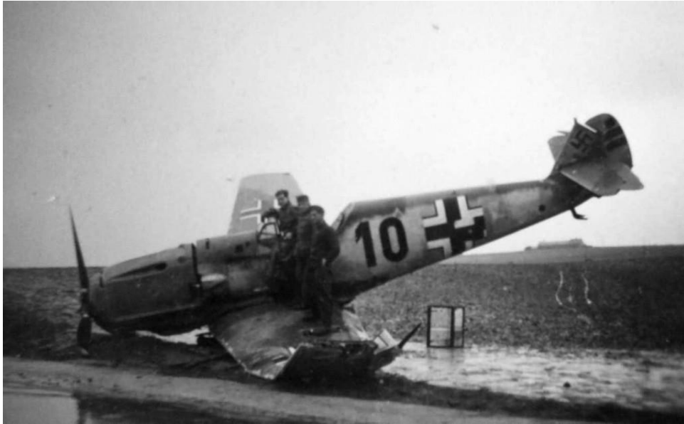
Algemeen: een Messerschmitt Bf-109 na een noodlanding